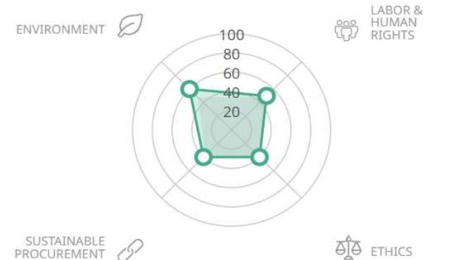
Theme score comparison

○ CHAROEN POKPHAND AGRICULTURE CO LTD score