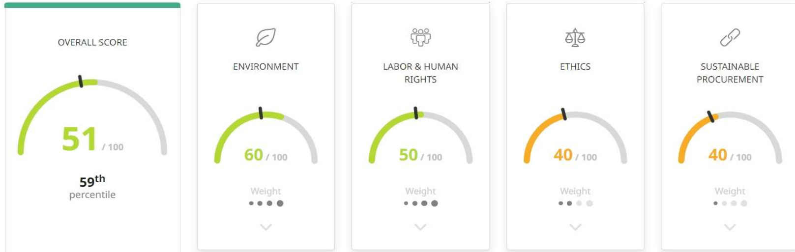
Overall score distribution